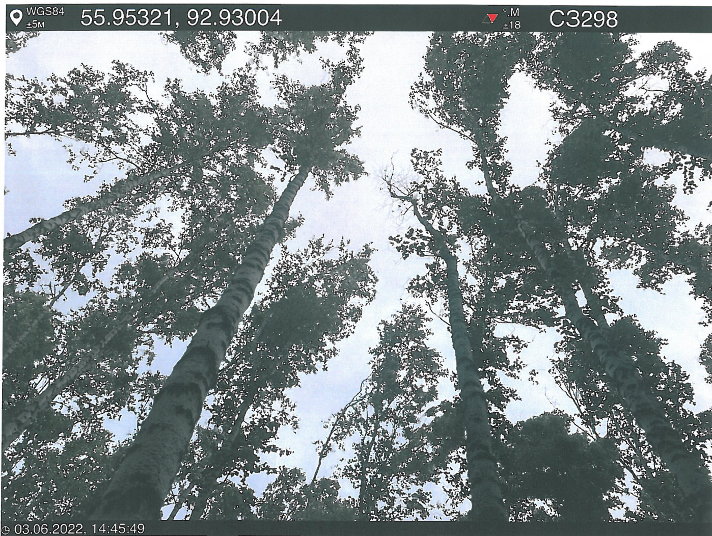
Фото – отчет о выполнении работ по проведению лесопатологического обследования в 2022 году. Лесных насаждений Городского лесничества г. Красноярск, Красноярский край(субъект РФ) Базайское участковое лесничество Квартал 30 выдел 9, площадь выдела 14,6 га.

Исполнитель работ по проведению лесопатологического обследования: